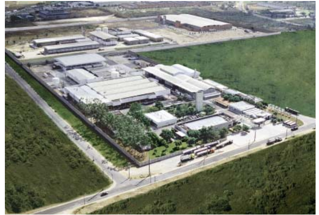
Visão aérea da Agripec

Severity = Número de dias perdidos por mil horas trabalhadas.